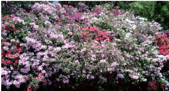
病院敷地内に咲き乱れる色とりどりのツツジ

凸字型をした部屋は4つの個室空間があり、各ベッド空間には必ず1つの窓があり、そこからは朝・夕そして四季折々に美しい景色を望むことができます。