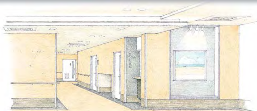
正面玄関と医療相談窓口

正面玄関には絵画が飾られ、来院者を温かく迎え入れます。 また、その先には医療相談窓口があり、どなたにも気兼ねなく訪れていただけるようになっています。