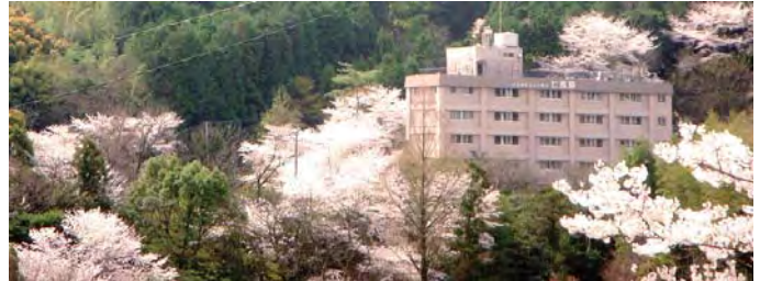
春には乙金の森にたくさんの桜の花