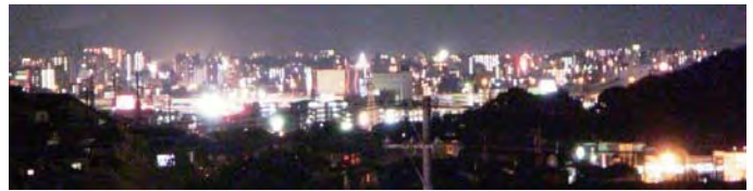
新棟から望む夜の大野城市市街地