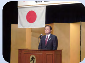
春日市長のご祝辞（記念祝賀会）