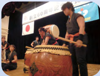
勇壮な大文字太鼓（記念祝賀会）