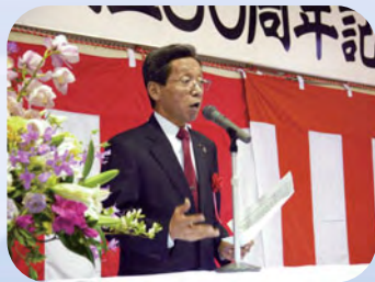
大野城市長のご祝辞（記念式典）

おかげさまで医療法人同仁会は、人間で言えば還暦という大きな節目を迎えることができました。これからも、基本理念に掲げる「病院は病者のためにある」ことを念頭に、地域に根ざした医療機関として地域の皆様とともに歩んで参ります。