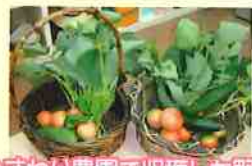
ひまわり農園で収穫した野菜