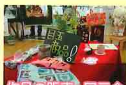
作品の販売・展示会