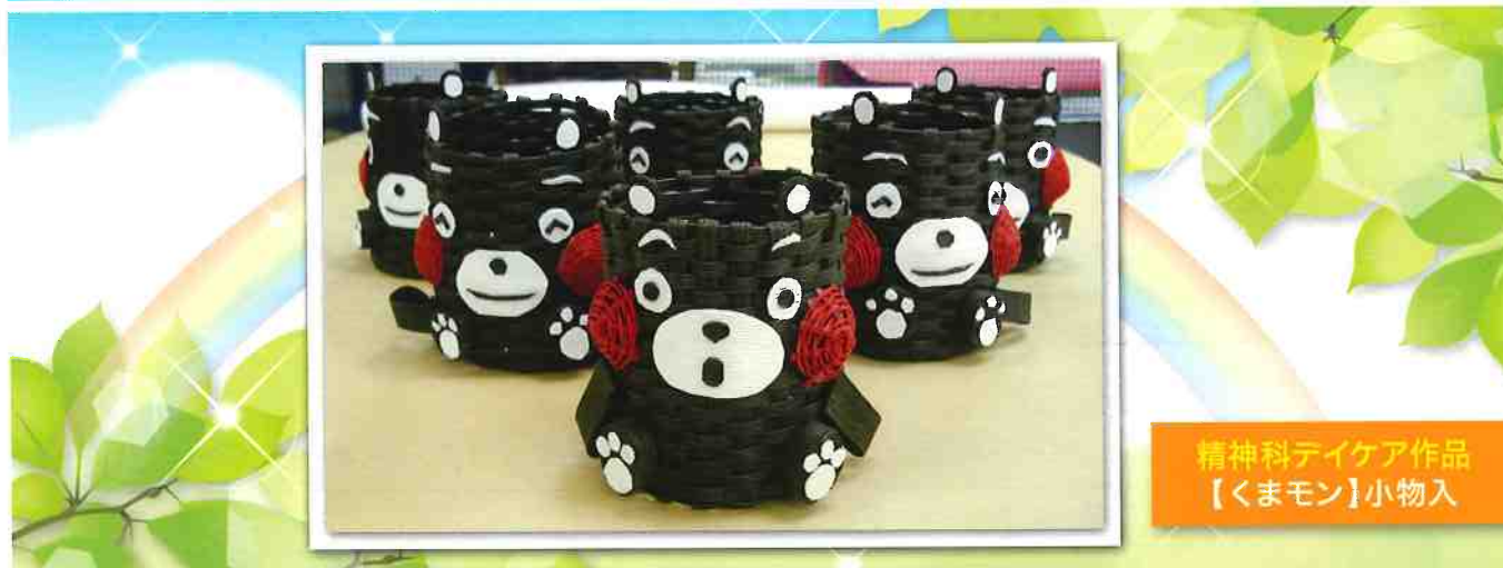
精神科デイケア作品 【くまモン】小物入

日本医療機能評価機構 認定病院 医療法人 同仁会 乙金病院 2015年7月 発行