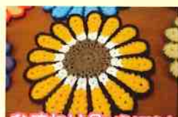
ひまわりクラクション