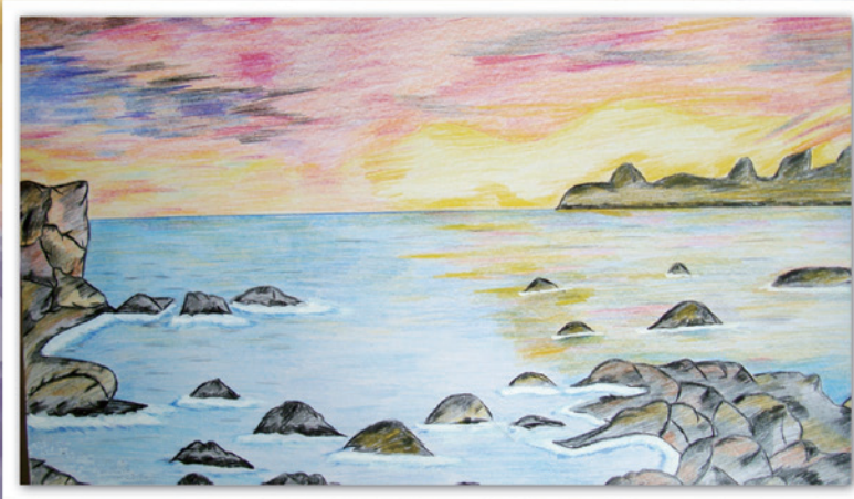
精神科デイケアひまわり ご利用者の絵画作品